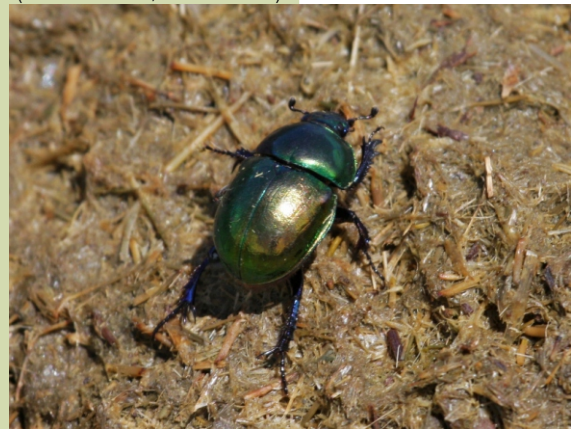
Escaravello bosteiro. Este fermoso insecto de case 2 cm de lonxitude atópase habitualmente nas bostas do gando.