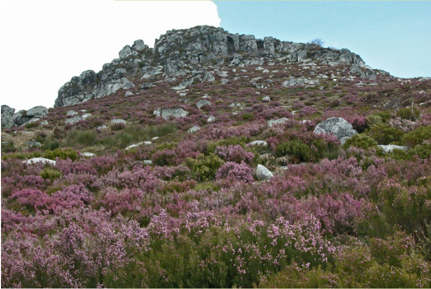
Detalle dos cumes graníticos na primavera onde domina a cor rosada dos breixos en flor.