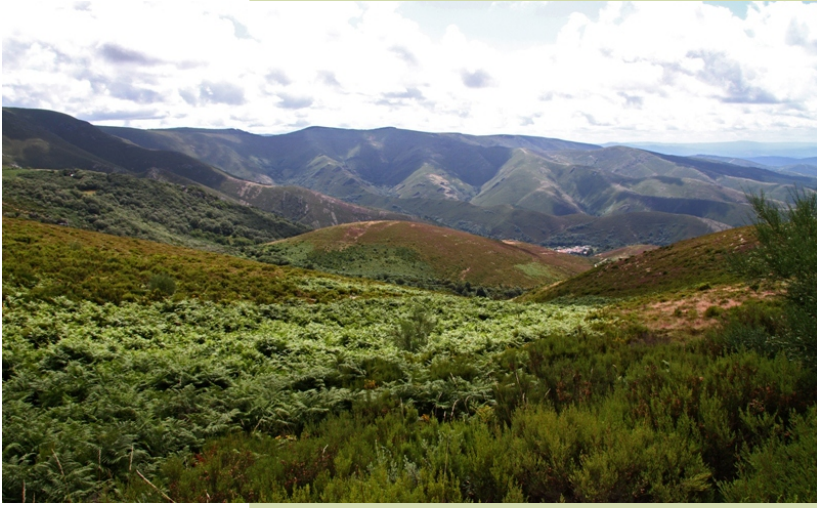
Camiño de San Mamede, ao fondo o val do Arnoia e Rebordechao.