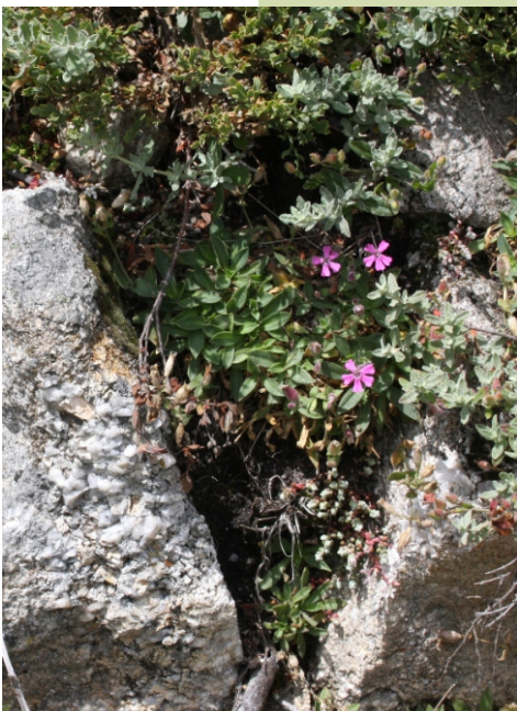
Colexas ( Silene acutifolia )