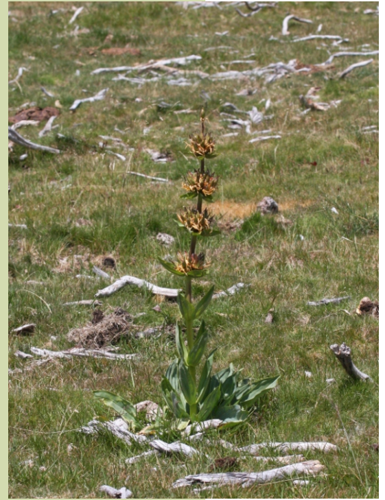
Xensá ( Gentiana lutea , var. aurantica ).