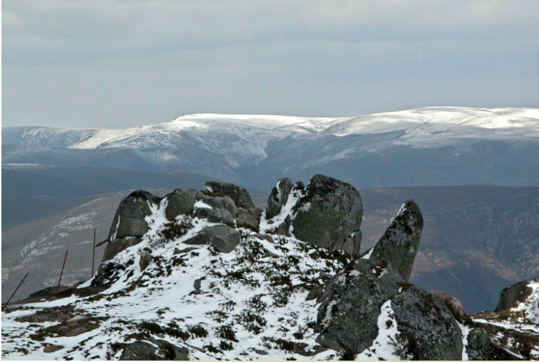
Cabeza de Manzaneda desde o cumo de San Mamede, no inverno.