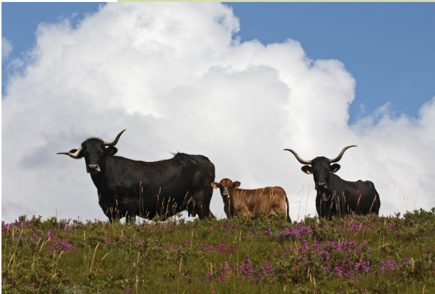
Gando de de raza caldelá nos pasteiros da aba sur de San Mamede.