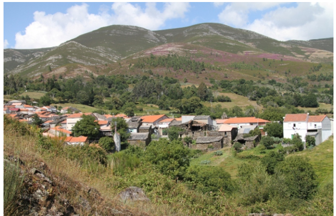
Rebordechao, a poboación que se atopa máis preto do San Mamede e punto de partida da ruta.