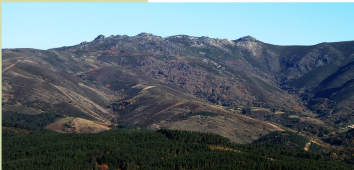
Vista sur de San Mamede. A serra de San Mamede está formada por xistos e areíscas que orixinan un relevo de formas redondeadas e suaves e nos cumes por granitos de dúas micas e algunha cuarcita que lle dan á paisaxe un aspecto ruiforme e de grandes penedos. O cume máis alto, San Mamede, acadá os 1.619 m.