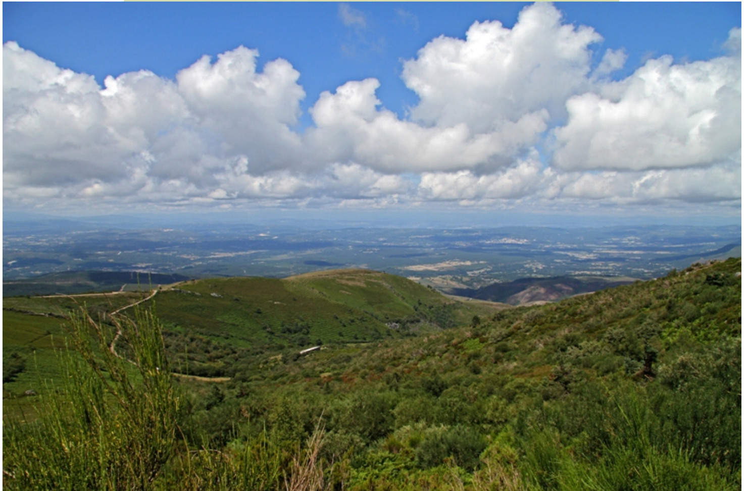
Vista desde o alto de San Mamede cara ao Penedo da Lebre e a depresión de Maceda.